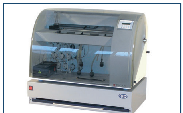
Tecan Profi Blot™ + AID Scanning System

Sprechen Sie uns an oder kontaktieren Sie uns unter info@aid-diagnostika.com !